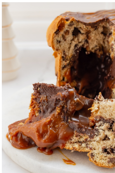
Panetone Recheado Caramelo, Flor de Sal e Ganache Meio Amargo - 1 kg