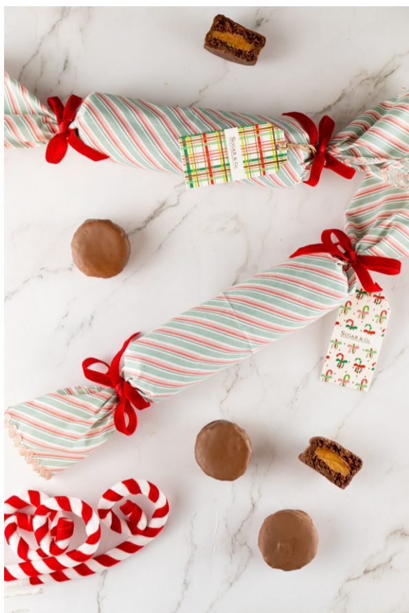
Pão de Mel - 6 unid. Recheado com Doce de Leite