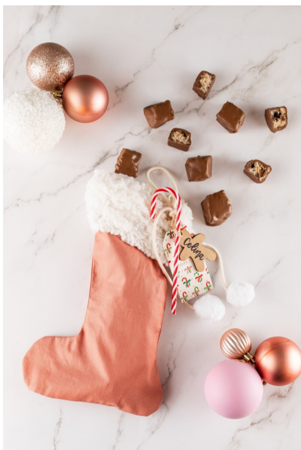
Botinha Panetone Pops - 190 gr