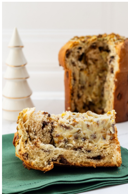
Panetone Recheado Pistache - 1 kg