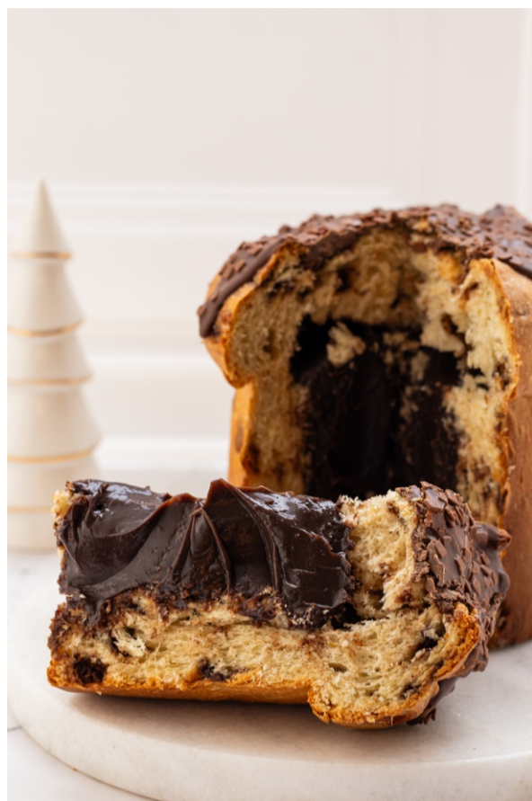
Panetone Recheado Brigadeiro Belga - 1 kg