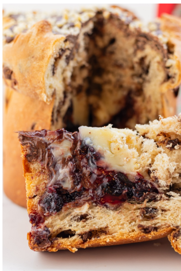
Panetone Recheado Brigadeiro Branco, Nutella e Geléia de Frutas Vermelhas - 1 kg