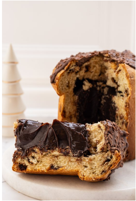
Panetone Recheado Brigadeiro Belga - 1 kg