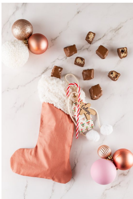
Botinha Panetone Pops - 190 gr