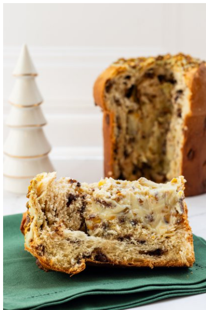
Panetone Recheado Pistache - 1 kg