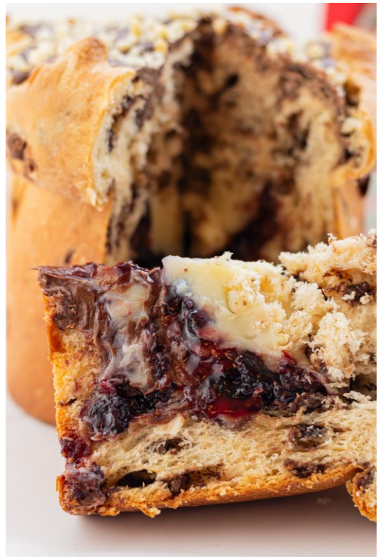
Panetone Recheado Brigadeiro Branco, Nutella e Geléia de Frutas Vermelhas - 1 kg