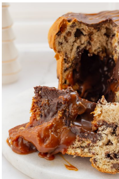
Panetone Recheado Caramelo, Flor de Sal e Ganache Meio Amargo - 1 kg